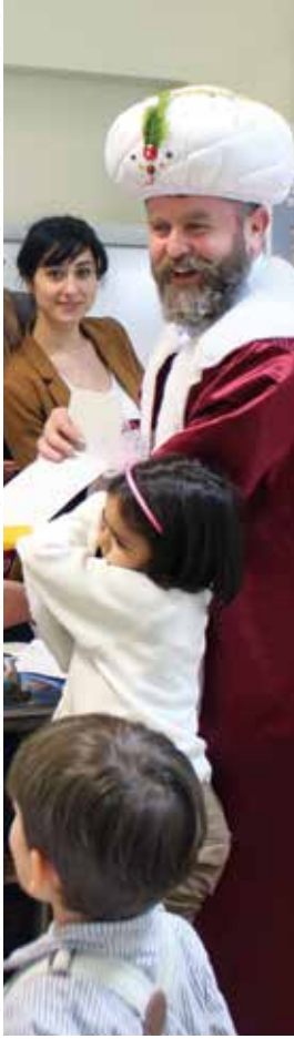
1 NİSAN NASRETTİN HOCA MİZAH GÜNÜ