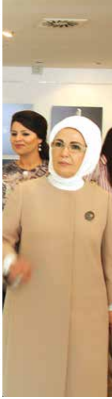
EMİNE ERDOĞAN SARAYBOSNA YUNUS EMRE ENSTİTÜSÜNDE