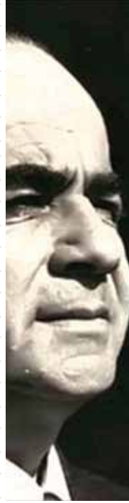
HAN DUVARLARI ŞAİRİ ASTANA'DA ANILDI