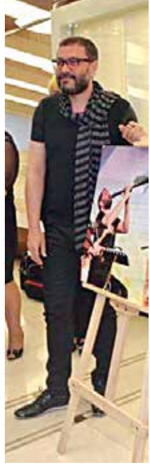
SAHNEDEKİ TÜRKİYE PROJESİ AZERBAJCAN'DA